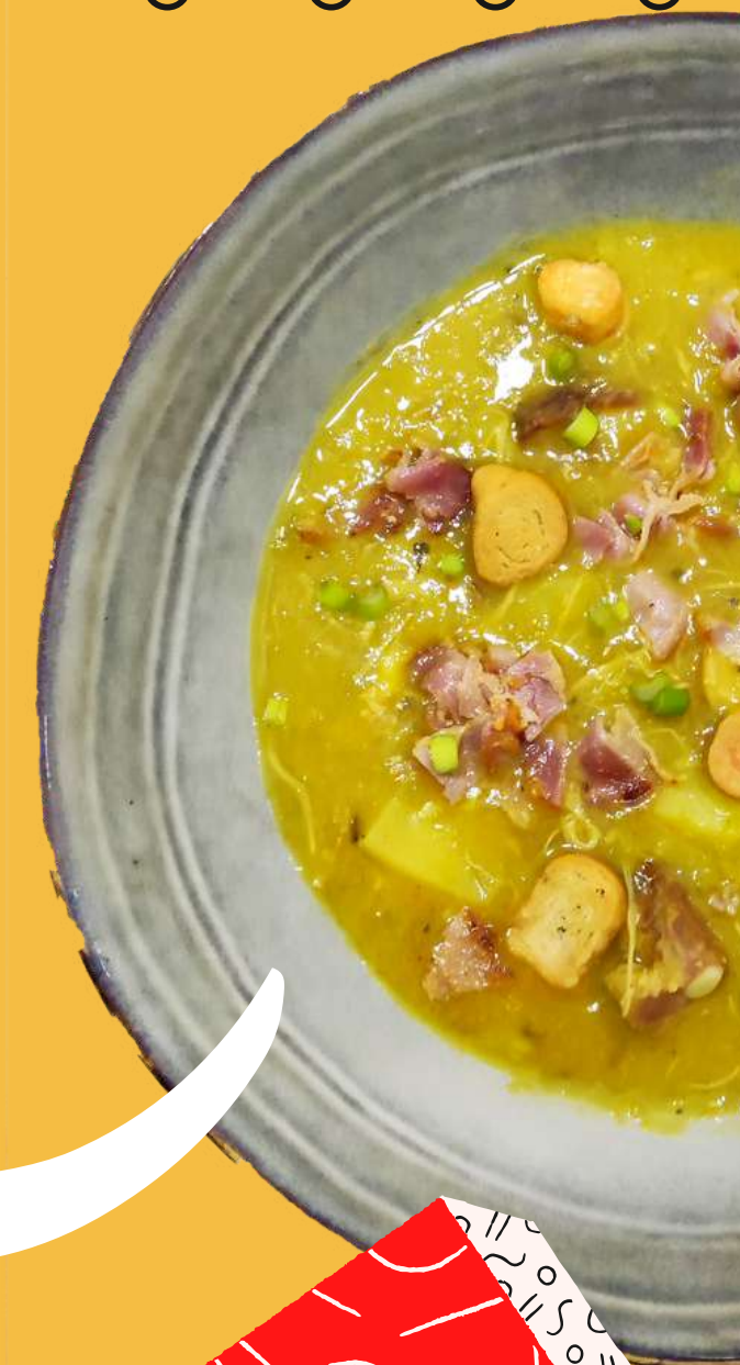
СУП В ПИРОЖКЕ